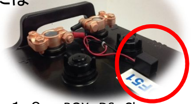
1. 0cmBOX DS Charge 強力に電池寿命伸ばす！

大手企業担当者の話：大型のバッテリーは安い価格のバッテリーより結果的に寿命(交換)の長い 国産品を使用するほうが、結果的に価格は高いが、コストは安いので購入するといえます。 ※搭載型は国産品より長く、安く、使用できるようになりました。